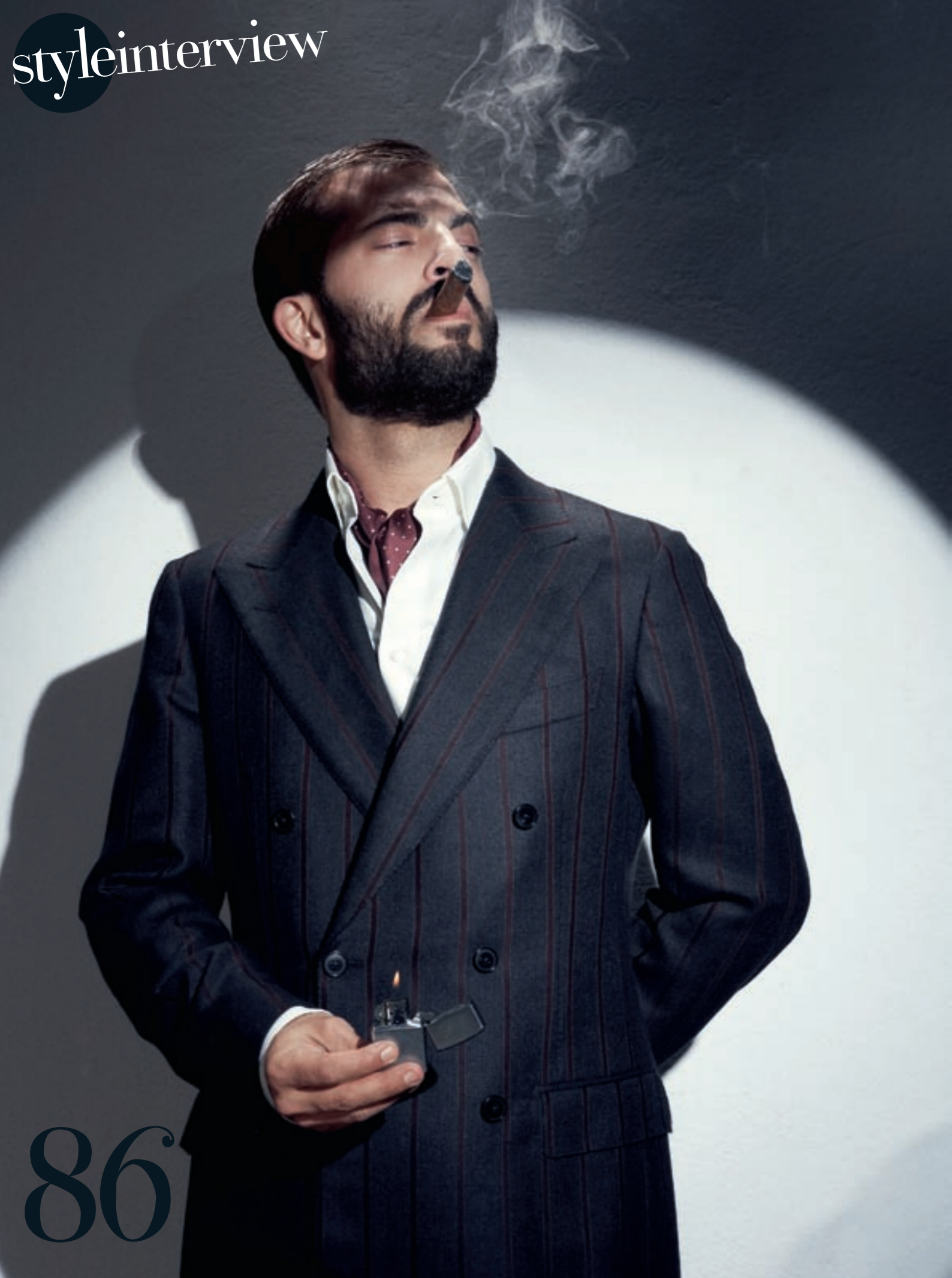
Auf dieser und den folgenden Seiten: Gestreifter Kaschmiranzug mit Doppelreihung und weite Hose, Hemd, Gavroche-Tuch, Fedora-Hut und Schuhe, ERMENEGILDO ZEGNA . Kniestrümpfe aus Merinowolle No. 7, FALKE . Feuerzeug, ZIPPO .